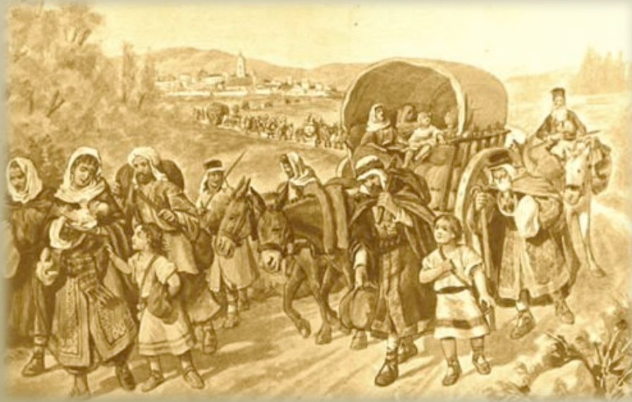
Judíos dejando España. Grabado del siglo XIX, Madrid

DEJANDO HUELLAS está contada en tres partes y en cada una es la protagonista la que propulsa la historia hacia delante. La persona que vemos sobre el escenario encarna tres mujeres de generaciones distintas. Ellas son partes de la misma mujer, conectadas por un mismo pasado y un mismo camino. La primera parte recuerda la despedida de los judíos de la tierra española durante la época de la Inquisición. La segunda parte relata cómo años después un grupo de estos judíos sefardíes llegaron a Persia. Y en la tercera parte volvemos a España en el tiempo presente para descubrir el destino de la protagonista. Cada parte empieza con un texto descriptivo y sigue con un cuadro proyectado que va apareciendo mientras se desarrolla la acción.