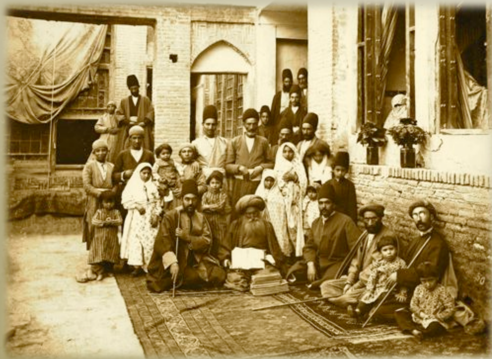
La familia de Leilah en Irán, hacia 1880

TEXTO: Posteriormente, un grupo de estos judíos sefardíes emigraron a la antigua Persia.